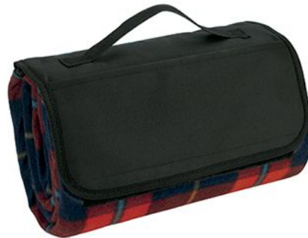
Figure A5: Image 2 Projected on the Wall to Present Objects. For Stage 2 with objects pair consisting of thermos and picnic mat.

Bitte schließen Sie den Vorhang Ihrer Kabine und lesen die folgenden Informationen. Alle Eingaben, die Sie in diesem Experiment am Computer machen, sind völlig anonym und können nicht mit Ihrer Person in Verbindung gebracht werden. Es geht an keiner Stelle in diesem Experiment um Schnelligkeit. Bitte nehmen Sie sich stets ausreichend Zeit, um die Anweisungen zu lesen und zu verstehen.